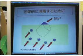
パソコンでいつでも、研修を受講できます。

このような工夫をして、全職員が研修を受講できるよう取り組んでいます。300人ほどの常勤職員の中で当日参加出来る人数は毎回100人程度ですが、フオローアップ研修を用意することで、参加できなかった職員も受講できています。そんな受講者の声を参考にし、次の研修を企画し、職員の知識・技術の向上に寄与すべく、教育委員会の努力は続きます！