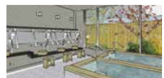
寛ぎの大浴場。共用浴室、介護浴室も完備。