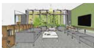
ゆったりとしたラウンジスペース。