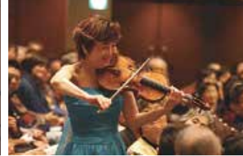
大谷 康子(ヴァイオリン)