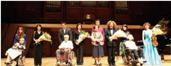
出演者へ施設ご利用者から花束贈呈