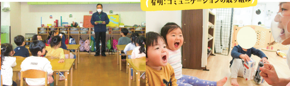
有明：コミュニケーションの取り組み

今後も、専門職としての保育士が、園児の健やかな成長を第一に考え、新たな取り組みにチャレンジができる環境を整備したいと思います。