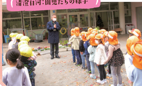
清澄白河：園児たちの様子

保護者とのかかわり、地域とのかかわりが希薄にならないようzoomでモニター越しにコミュニケーションをとって交流機会を継続してきました。ようやく最近になって幼稚園や小学校を子どもたちが訪問して直接顔を合わせて交流ができるようになり、ホッとしています。