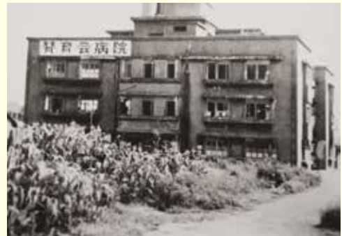
【戦後の外来棟西館の風景】1948年(昭和23年)