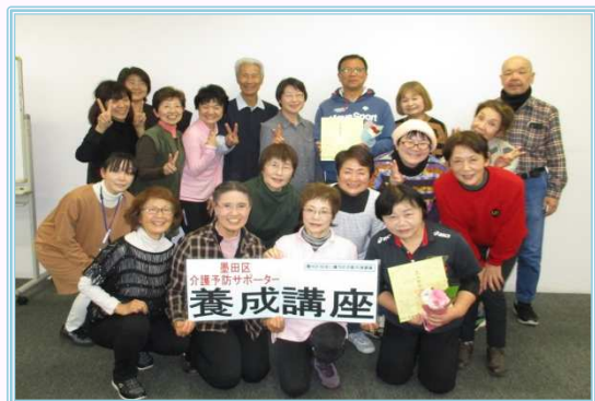
平成29年度「介護予防サポーター養成講座」修了生

今年度の『 介護予防サポーター養成講座 』(全6回)は、11月5日から12月10日までの毎週月曜日に行う予定です。