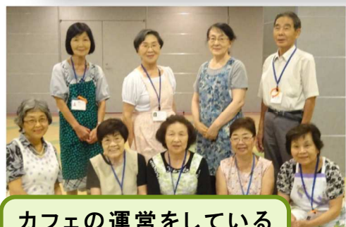
カフェの運営をしている 見守り協力員のみなさん