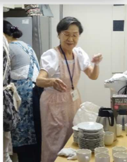
美味しいコーヒーを準備!