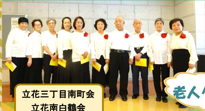
立花三丁目南町会 立花南白鶴会