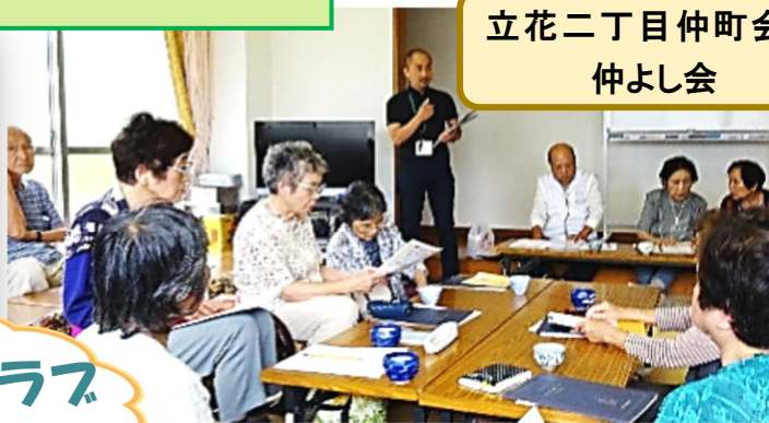
立花二丁目仲町会 仲よし会