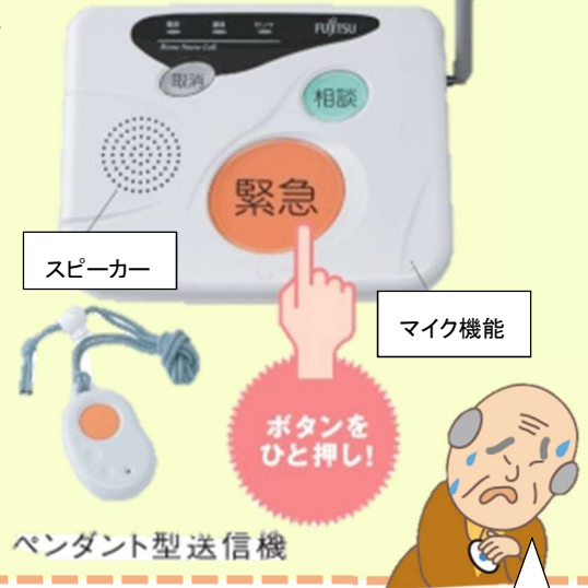
ペンダント型送信機