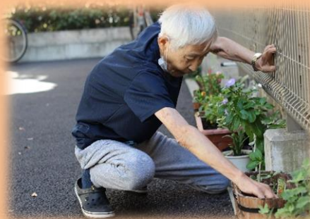
お花の手入れの様子

また、入居者の方の中にはお花が好きだったり、お花を育てるのが好きな方がおられます。これからの新しい取り組みとして、敷地内でお花を育てる活動を開始しようと考えています。