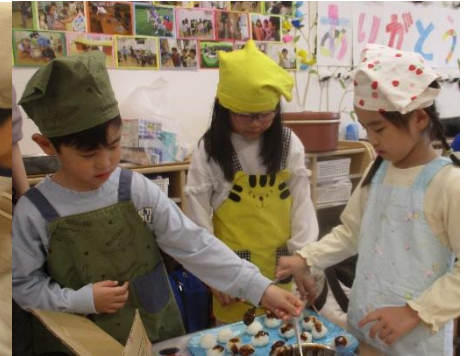
手作りほと組味噌