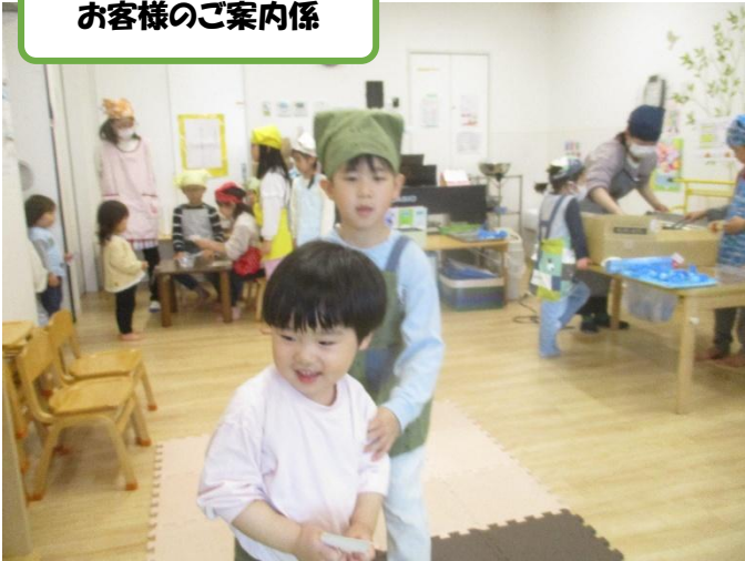
お客様のご案内係