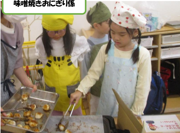
味噌焼きおにぎり係