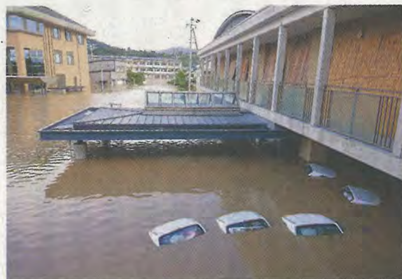
台風19号で水没した特養玄関(豊野事業所、2019年10月13日)