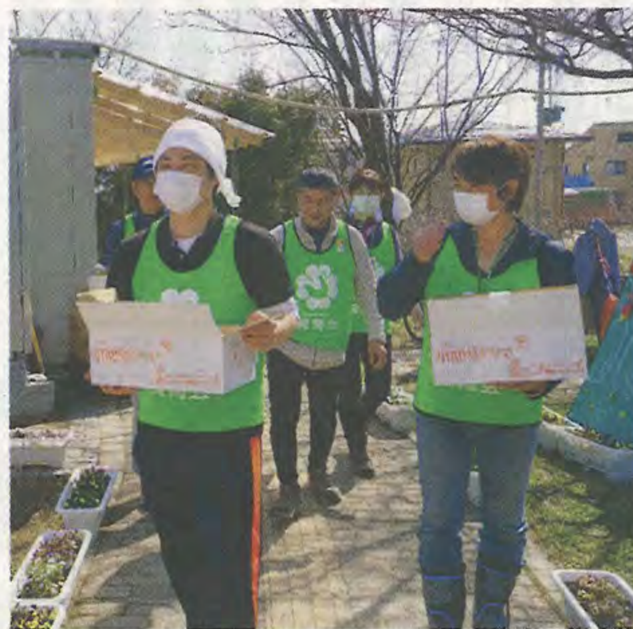
「ぬくぬく亭」で奮闘する職員