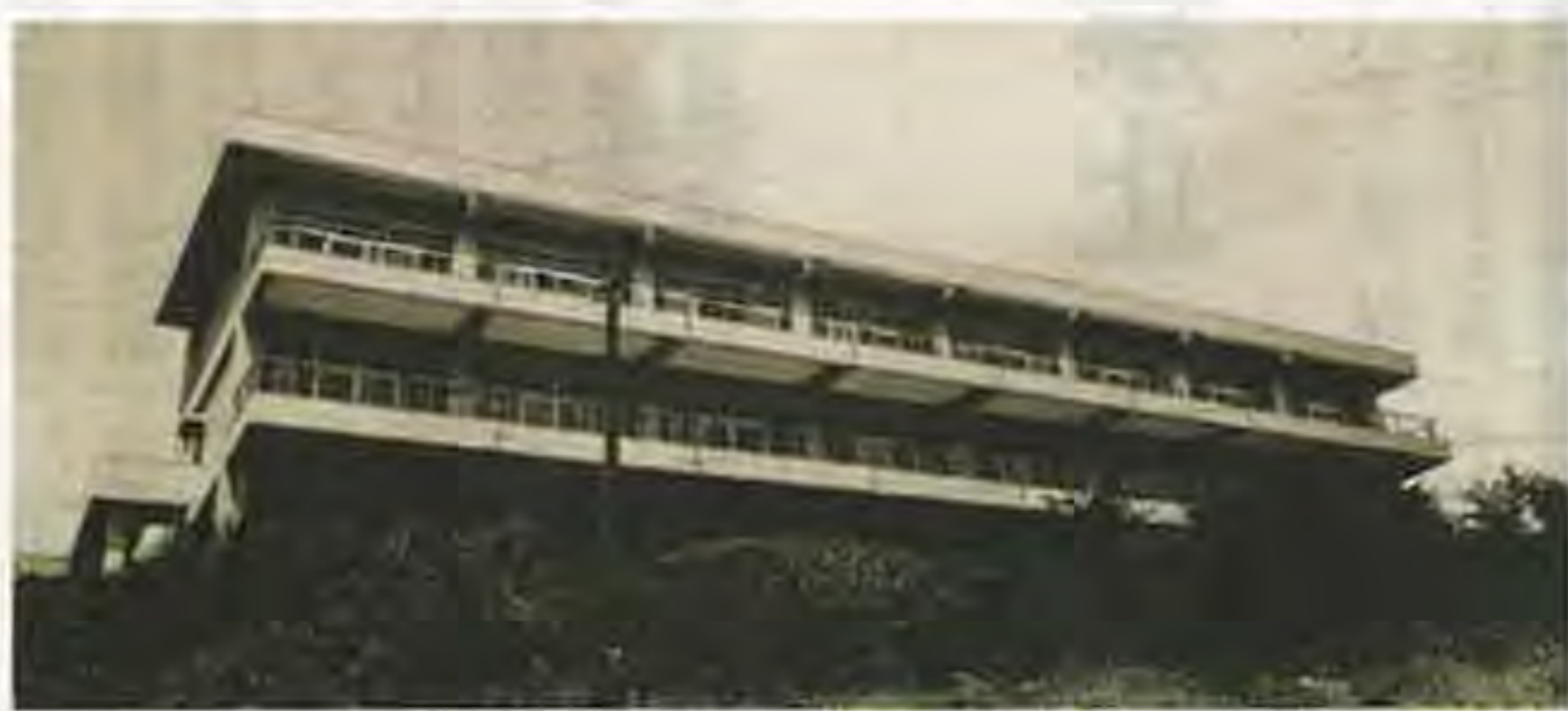
清風園（町田）・当時の建物風景（昭和39年）