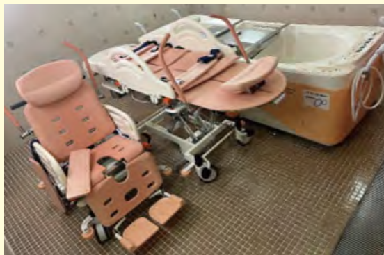
▲椅子型ストレッチャー、ストレッチャー、浴槽本体