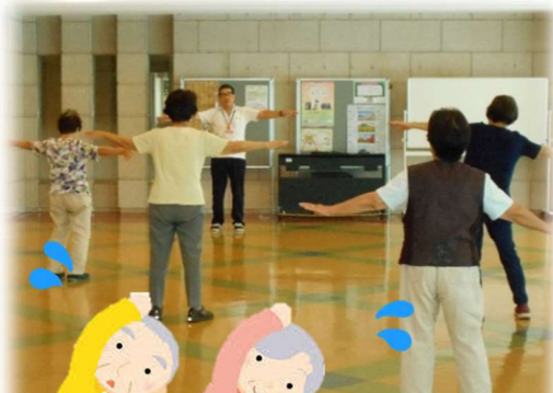
自主グループ活動 さわやか体操会

厚生労働省が2018年に発表した資料によると、男性の平均寿命は80.21歳、健康寿命は71.19歳となっており、約9年の開きがあることがわかります。さらに、女性の平均寿命は86.61歳、健康寿命は74.21歳と男性以上に大きな差が生じています。誰でも元気でいられる期間が長い方がよいと思うはず。「人生100年時代」と言われる昨今、生活の中でできる健康寿命を延ばすポイントをご紹介します。