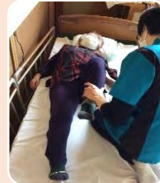
ベッド上で機能改善