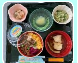
2023年度 はとバスツアー弁当