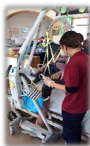
移乗サポート で楽に安心

健康チェック後、身体状況に応じた浴槽で入浴できます。 タオル・バスタオルは不要です。