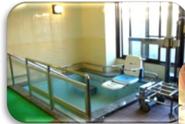
一般浴 歩ける方 歩行不安で椅子のまま