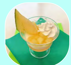
アローマメロンの メロンパフェ