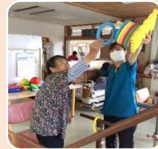
腕を上げて物をつかむ

家での暮らしがずっと続けられるよう、ケアマネさんのプランに沿って、ご本人の希望や家での生活に合わせた個別の運動です。 ・お風呂に入る ・洗濯物を干す、取り込む ・仏壇で手を合わせる ・車の乗り降り ・上がり框の上り下り ・ズボンの上げ下ろしや服の脱ぎ着などができるようになる