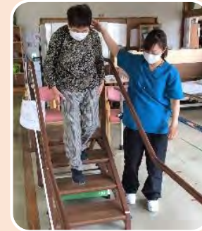
手すりを持たずに段差を上がる・降りる