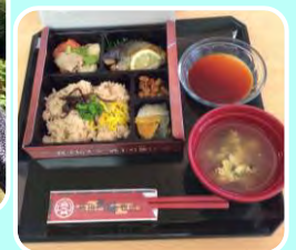
2022年度 戦国武将弁当