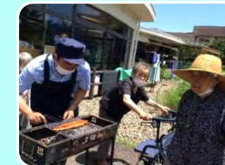
うなぎのかば焼き