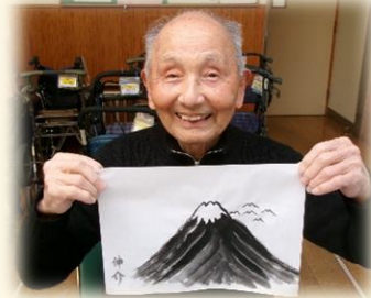
ボランティアの先生に来ていただき、水墨画の活動を始めました。