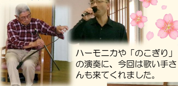
ハーモニカや「のこぎり」の演奏に、今回は歌い手さんも来てくれました。